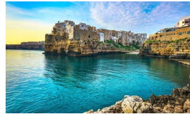
TENGER - 20 PERC