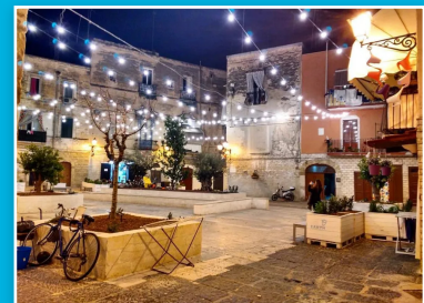
Piazza degli Innamorati